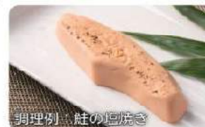
調理例：鮭の塩焼き