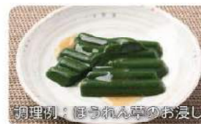
調理例：ほうれん草のお浸し

ミキサー粥やでんぷん食品の付着性を改善します 唾液による離水の影響を最小限に抑えます 65℃でも溶け出さないため、温冷配膳車が使えます